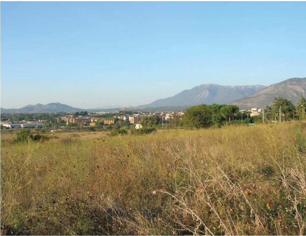
All. 4 - Vista dell'Area della lottizzazione Nathan